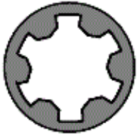
524.160 M 12x1,25x198

Anziehreihenfolge/Tightening sequence/Ordre de serrage/Orden de apriete