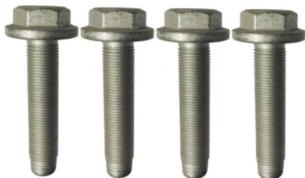
R159.64 : Peugeot 308 II