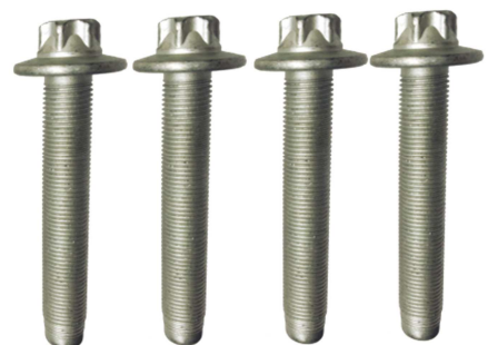
R159.65 : Citroën C4 Picasso II