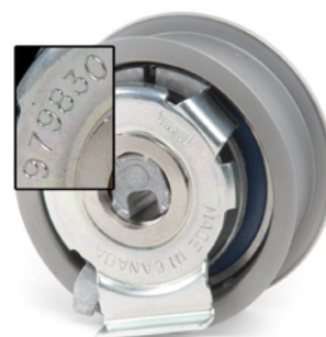
Photo 2: 531 0851 10 – Nouveau galet tendeur (979830)

En raison de nouvelles spécifications, le galet tendeur réf. 531 0851 10 remplace le galet tendeur réf. 531 0777 10.