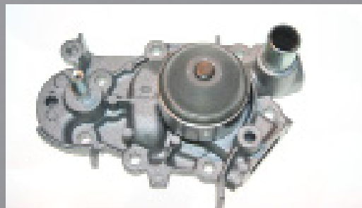
Figure 1 : pompe à eau 65500 (version remplacée)

Respecter les instructions du constructeur