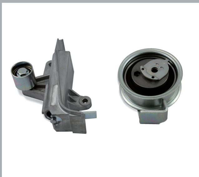
Photo 1: à gauche, amortisseur de vibrations réf.: 55712, à droite, galet tendeur réf.: 55496

La nouvelle poulie de renvoi avec support réf.: 56365 a seulement la fonction de renvoi. (s. Bild 2) La tension de la courroie et l'amortissement sont exclusivement assurés par le galet tendeur réf.: 56364.