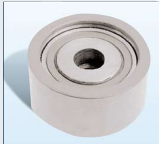
Fig. 2 : 55707 (nouvelle version)

Le galet de renvoi 55459 doit être monté avec une vis à six-pans creux avec une longueur de filetage de 40 mm.