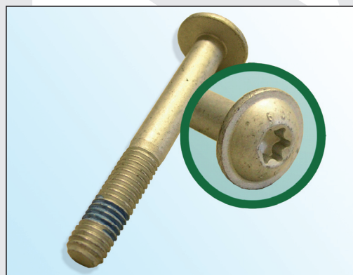
Fig. 2 : vis RUVILLE

Vous trouverez les pièces de rechange correspondantes dans notre catalogue en ligne sur le site www.ruville.de