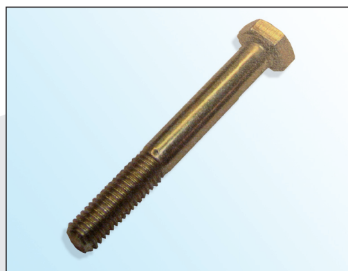
Fig. 2 : vis OE