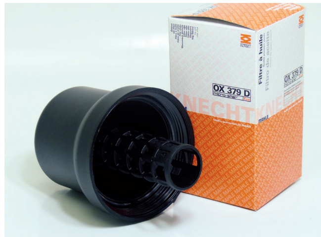
Рисунок 1: Картридж масляного фильтра с демонтированной крышкой корпуса

Что касается прокладок указанных картриджей, то здесь следует обращать внимание, чтобы язычок после монтажа был виден и смотрел вверх (см. рис. 3). Если прокладка будет установлена неправильно или язычок попадет в резьбу (см. рис. 4), то через крышку фильтра будет протекать масло.