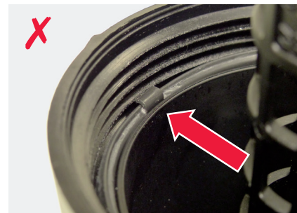
Рисунок 4: Защемление язычка в резьбе

ВАЖНО! Во избежание повреждений и утечек всегда смазывайте прокладки перед монтажом свежим маслом. Кроме того, слишком высокий момент затяжки может также привести к утечке масла — поэтому всегда следует соблюдать указания производителя!