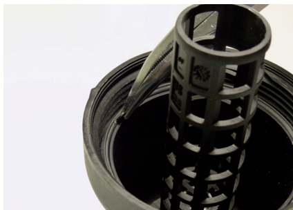
Рисунок 2: Язычок помогает удалить старую прокладку