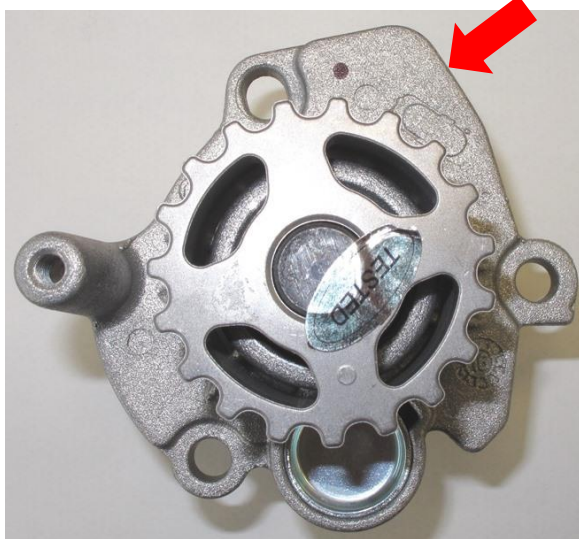
OLD VERSION / VECCHIA VERSIONE