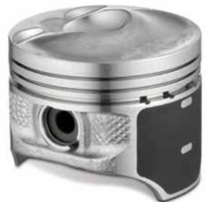
Pistons KS avec fond de piston spécial pour le mode charge stratifiée

Un papillon pas complètement ouvert dans le système d'aspiration réduit l'admission d'air frais. La résistance ainsi obtenue génère des « pertes d'étranglement ». Toute mesure permettant d'ouvrir davantage le papillon (« Augmentation de l'ouverture du papillon »), réduit ces pertes d'étranglement et la consommation.