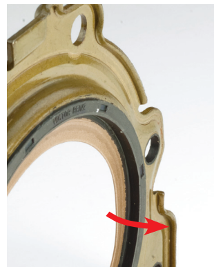
Figure 1 _La lèvres d'étanchéité est orientée vers la boîte de vitesses

Tenir impérativement compte de la notice de montage des bagues d'étanchéité en PTFE contenue dans le jeu.