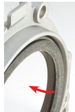
Figure 2 _La lèvres d'étanchéité est orientée vers l'intérieur du moteur